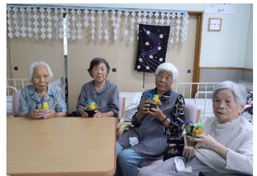
かわいい小鳥が完成🐦