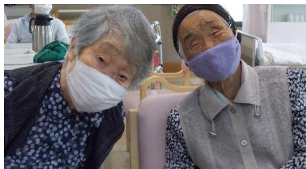
お二人とも笑顔で「ハイ・チーズ!!」