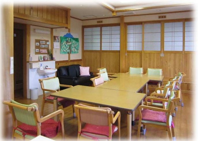
食堂兼機能訓練室

食堂にはシステムキッチンを設置、職員と一緒に料理やおやつづくりができます。畑で収穫した野菜を使って得意な料理の腕前を披露していただけます。